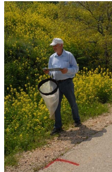
בתמונות: ניטור פרפרים הלכה למעשה.